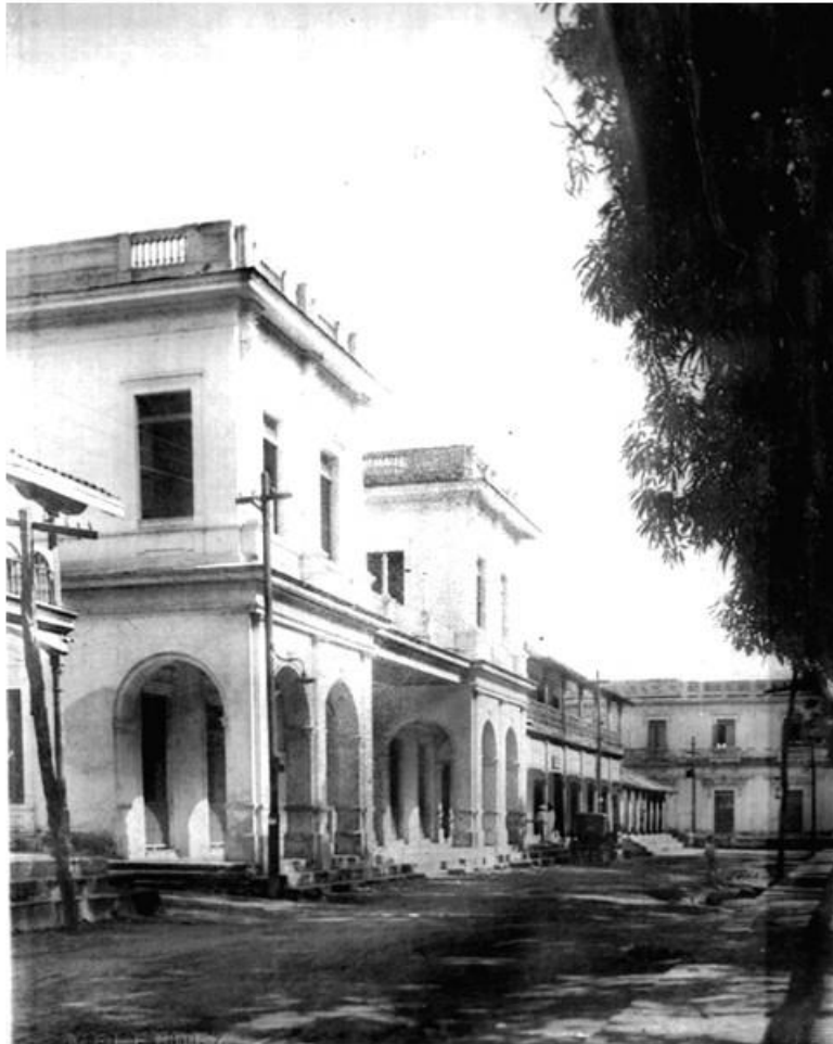
El edificio blanco es el antiguo club social, sigue el antiguo hotel Alhambra y una casa de una sola planta donde, posteriormente, César Lacayo construyó su casa de concreto.

modelos sureños observados durante viajes a los Estados Unidos, porque la influencia de los Estados Unidos en esa época era prácticamente nula.