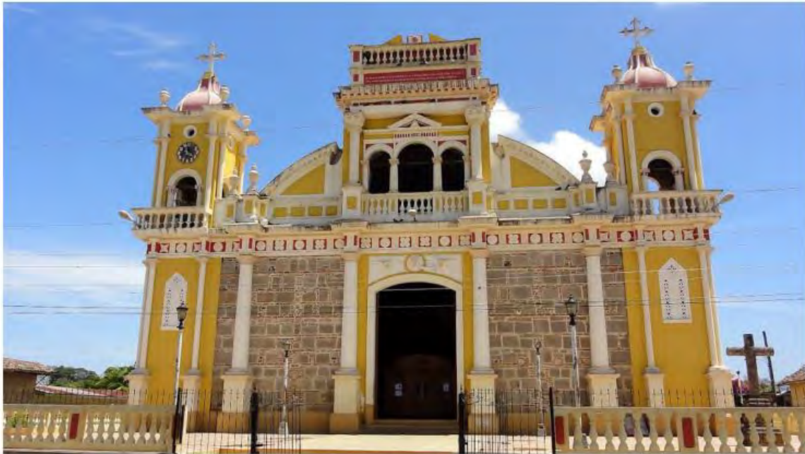
Iglesia de Diriomo

entonces en la Villa Mugnano. Entre las variaciones existentes del apellido Ferre están Ferraro, Ferrari, Ferrero, Ferrieri, Fevriero, Fer, Ferr, Ferrer, Ferry y Ferrey, entre muchas