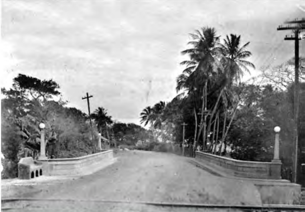
Puente de los Dardanelos, antes de la remodelación que agrego aceras peatonales.